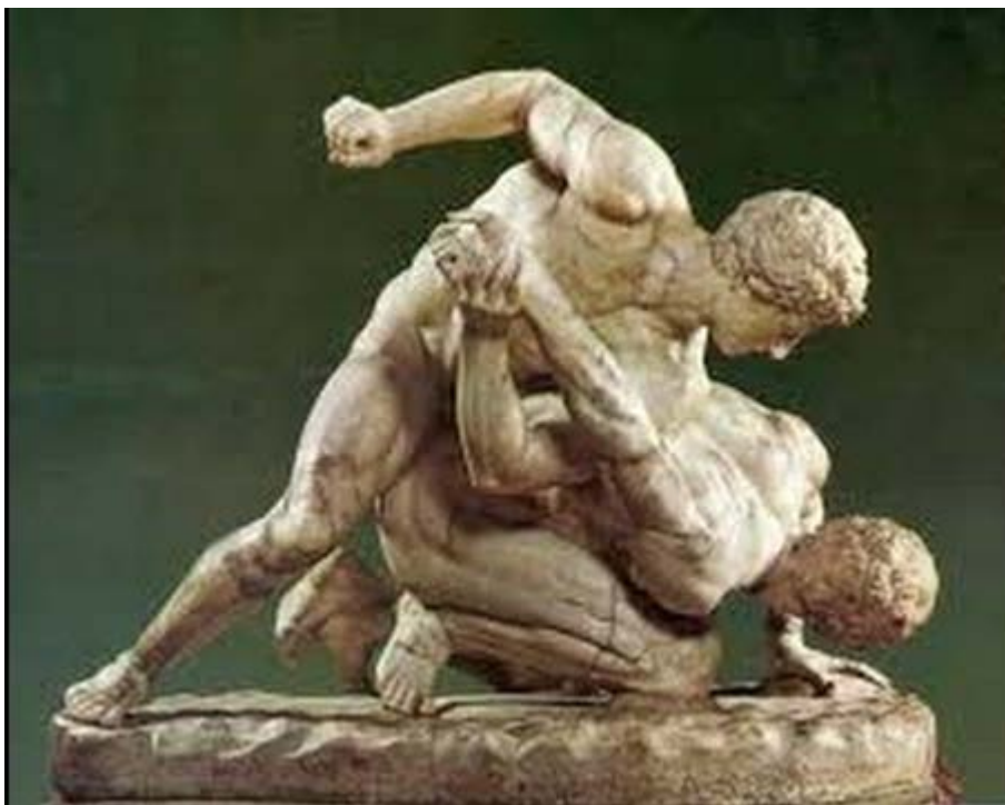
Εικόνα 1. Σύμπλεγμα παγκρατιαστών. 2ος αιώνας μ.Χ.. Φλωρεντία, Galleria Degli Uffizi.6 Απεικόνιση δυο τεχνικών στοιχείων παγκρατίου (πάλη- εξαρθρωτική λαβή άνω άκρου, πυγμή)

Από τα προϊστορικά χρόνια, οι άνθρωποι αναγκάστηκαν να αναπτύξουν μεθόδους άοπλης πάλης και ένοπλης μάχης για να βρουν τροφή και να αμυνθούν στις επιθέσεις των εχθρών τους. 2 Η ανάγκη για συστηματική μέθοδο άοπλης μάχης υπήρχε σε όλους τους αρχαίους πολιτισμούς και αυτή αποτέλεσε τη γενεσιουργό αιτία των πολεμικών τεχνών. 3 Η άοπλη συμπλοκή μεταξύ δύο ανθρώπων διεξάγονταν με τα χέρια, αλλά και με τα πόδια. 4 Στην αρχαία εποχή, οι πόλεμοι ήταν μια καθημερινότητα, επομένως η αποτελεσματικότητα που έδινε στη μάχη η εξάσκηση στο παγκράτιο ήταν ιδιαίτερα χρήσιμη. Όσο αναπτυσσόταν η μέθοδος του πολέμου και βασιζόταν στα όπλα, τόσο το παγκράτιο ως μέθοδος άοπλης μάχης υποβαθμιζόταν, παρέμεινε όμως πολύ σημαντικό ως μέσο στρατιωτικής εκπαίδευσης, συμβάλλοντας στην πειθαρχία, στην αντοχή στην κακουχία της μάχης. Γινόταν αντιληπτό ότι ο καλός μαχητής είναι ο ισχυρός κατά το σώμα και κατά την ψυχή και ότι αυτός δημιουργείται με την πάλη, την πυγμή και το παγκράτιο. 5