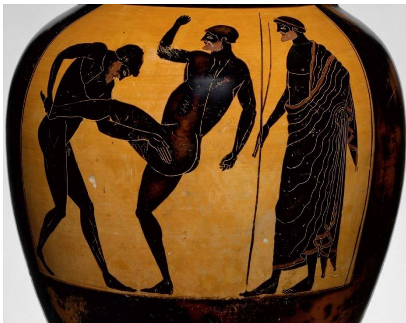
Εικόνα 3. Παναθηναϊκός αμφορέας. Αρχές 5ου αιώνα π.Χ., Ν. Υόρκη, Metropolitan Museum of Art. 57 Λάκτισμα «Γαστρίζειν», συνοδευόμενο με πυγμή και λαβή «Αποπτερνίζειν». Απεικόνιση τριών τεχνικών στοιχείων παγκρατίου (πάλη, πυγμή, λάκτισμα).

Για το παγκράτιο, όπως και για κάθε αγώνισμα οι Αρχαίοι Έλληνες πίστευαν ότι ήταν δημιούργημα κάποιου θεού, ημίθεου ή ήρωα, έλεγαν ότι το δημιούργησε ο Θησέας για να νικήσει τον Μινώταυρο στον Λαβύρινθο. Ο Πausανίας αναφέρει ότι, καθώς λένε, ο Ηρακλής κέρδισε νίκες σε πάλη και παγκράτιο, 58 ενώ, σύμφωνα με τον Αριστοτέλη, η τέχνη του παγκρατίου διαμορφώθηκε από τον Λεύκαρο τον Ακαρνάνα. 59